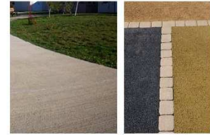
Béton balayé / béton coloré

Revêtement de sol : recherche sur la Matière, la Couleur, les Textures